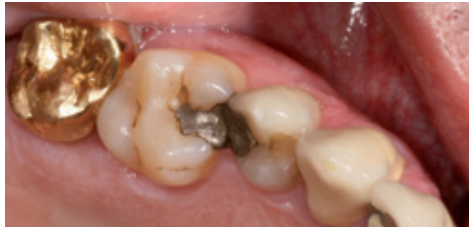
Klassisches Szenario: Goldkrone neben Amalgamfüllung – der Batterieeffekt.

unspezifische Symptome wie Stechen oder Druck in der Brust, unerklärtes Herzrasen, Tinnitus und Hörverlust, etc. sein [50].