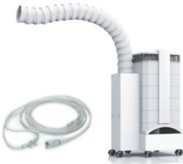
Kofferdamm, Sauerstoff-Zufuhr, CleanUp Sauger, IQ-Air und Mikronährstoffe